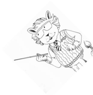
Figura 7: Gráfico con \text{width}=3.00 cm, \text{height}=3.00 cm y \text{angle}=45