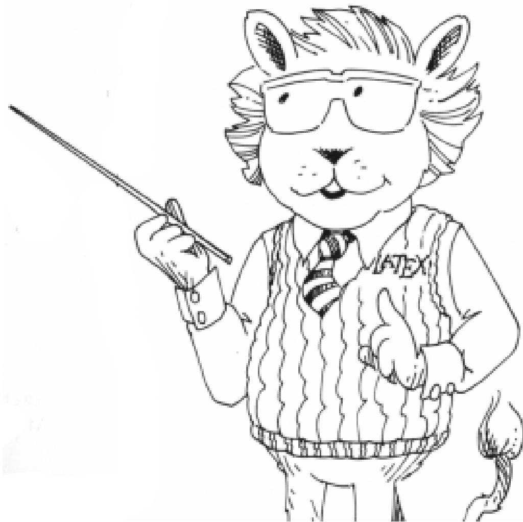
Figura 1: Gráfico con textwidth