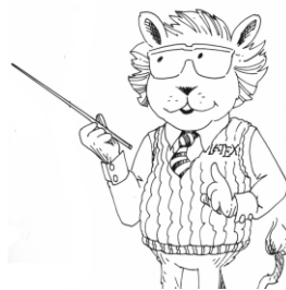
Figura 6: Gráfico con \text{scale}=0.75